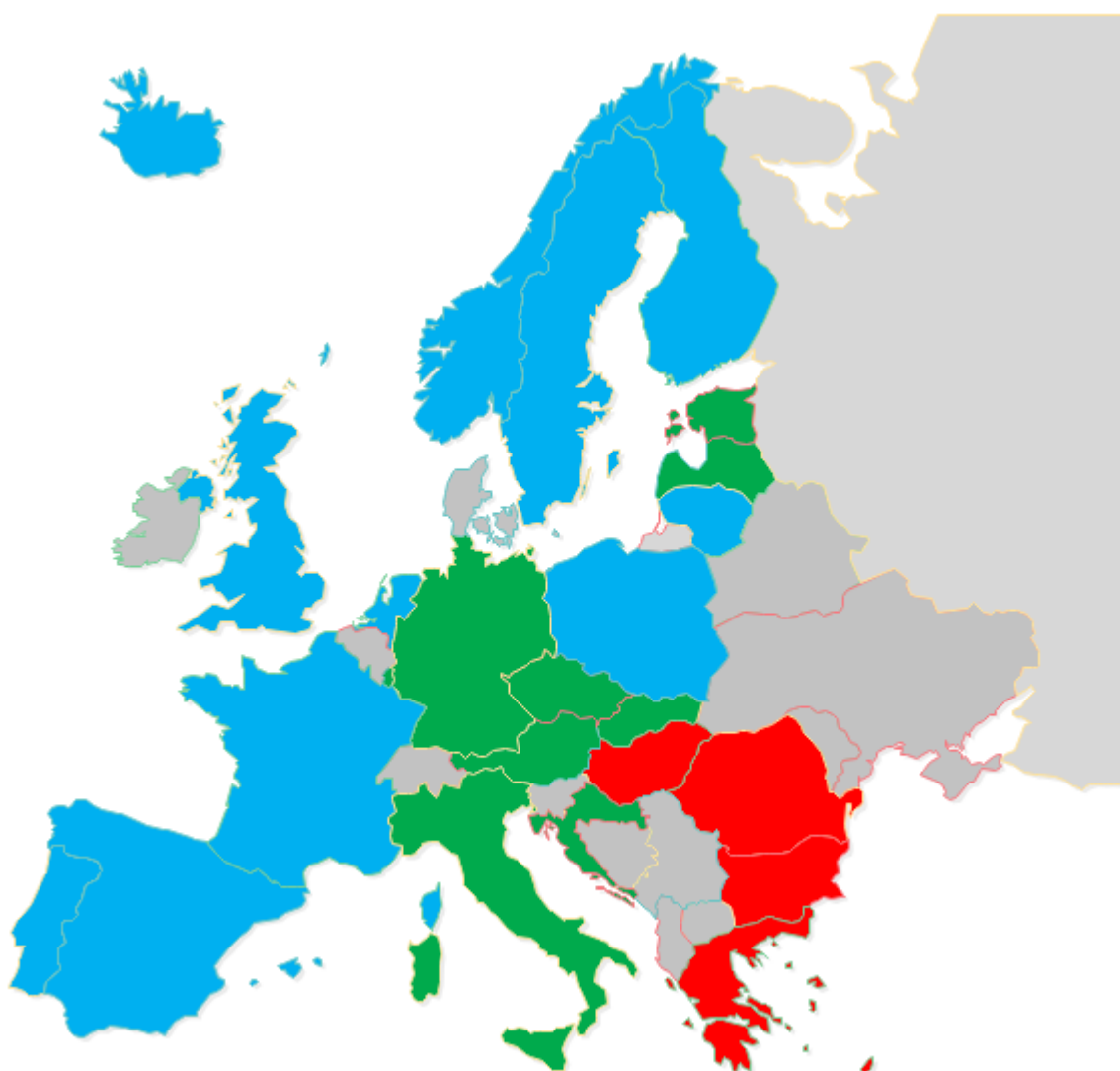
MAPA Európske štáty podľa liberálnosti ich učebnicovej politiky

V našom informačnom materiáli sme hodnotili rôzne aspekty učebnicovej politiky v európskych štátoch, najmä to, do akej miery je trh s učebnicami otvorený respektíve centralizovaný, či podliehajú učebnice procesom schvaľovania, či ich môže vydávať akékoľvek vydavateľstvo, kto učebnice vyberá, či je ich nákup premetom súťaže alebo je jednotne daný, kto ho financuje, prípadne do akej miery leží bremeno financovania učebníc na samotných žiakoch.