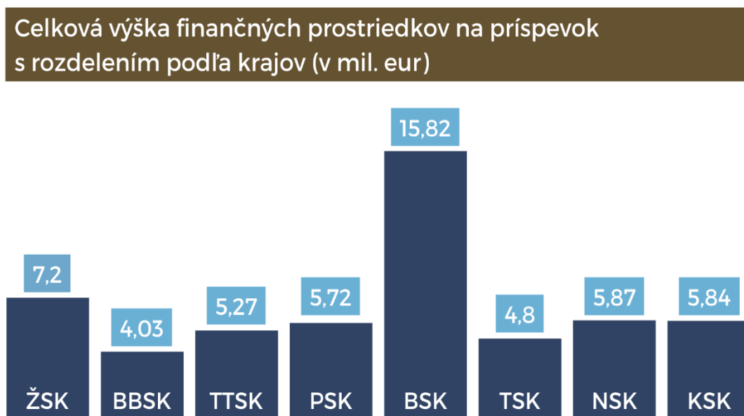
Graf č. 2: Celková výška finančných prostriedkov na príspevok s rozdelením podľa krajov (v mil. eur)