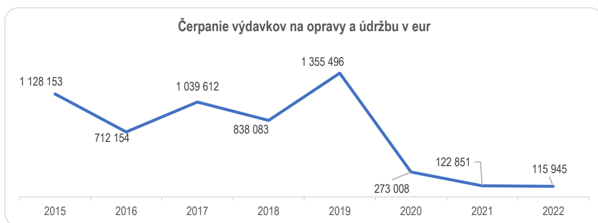
Graf č. 2 Čerpanie výdavkov na opravy a údržbu v rokoch 2015 až 2022 vyjadrené v eurách