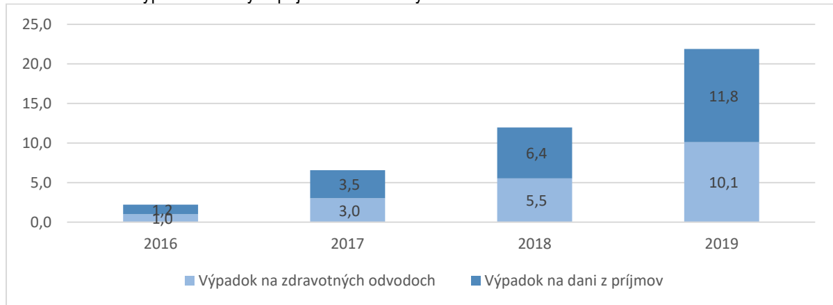
Graf č. 1 Odhad výpadku daňových príjmov a zdravotných odvodov v rokoch 2016 až 2019