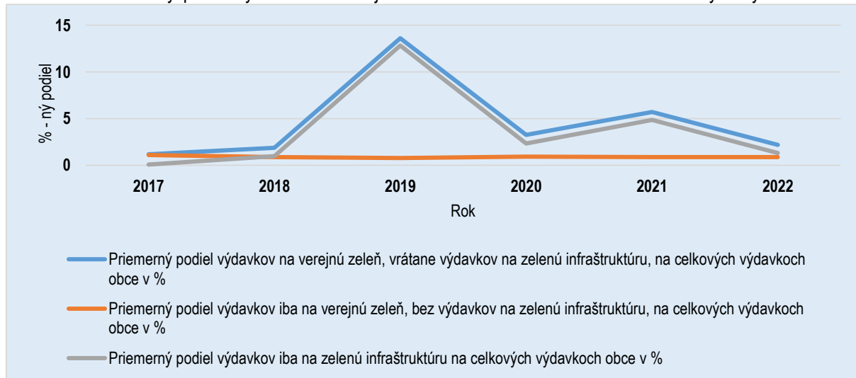
Graf č. 1 Priemerný podiel výdavkov na verejnú zeleň a zelenú infraštruktúru na celkových výdavkoch obcí

Priemerné ročné výdavky iba na verejnú zeleň v období 2017 až 2022, bez výdavkov na zelenú infraštruktúru, boli na úrovni 8,10 eur na obyvateľa.