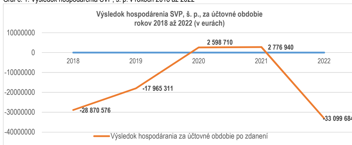
Graf č. 1: Výsledok hospodárenia SVP, š. p. v rokoch 2018 až 2022

Výsledok hospodárenia SVP, š. p., je vyjadrený v nasledovnom grafe.