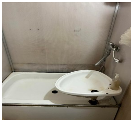
Obr. č. 1 Zrekonštruované a nezrekonštruované izby z vykonaných fyzických obhliadok