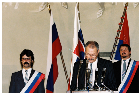
Slávnostný akt podpisu Ústavy SR, 3. september 1992