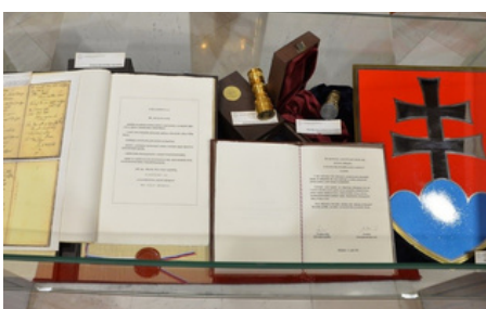
Ústava v Hurbanovej sieni hlavnej budovy NR SR