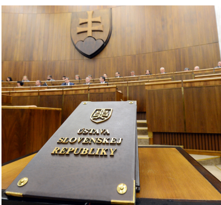
Originál Ústavy počas skladania sľubu poslancov NR SR