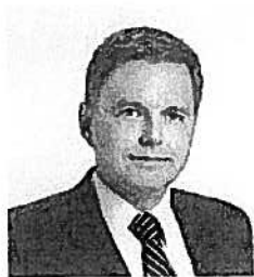
Ing. Peter Kažimír