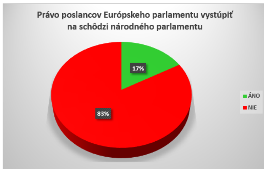
Graf č. 1 Právo poslancov Európskeho parlamentu vystúpiť v rozprave na schôdzi národného parlamentu