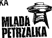
Mgr. Oliver Kríž

politická strana Fedinova 5 851 01 Bratislava IČO: 42 36 40 78