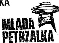
Mgr. Oliver Kríž

MLADÁ PETRŽALKA politická strana Fedinova 5 851 01 Bratislava IČO: 42 36 40 78