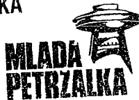
Mgr. Oliver Kríž

MLADÁ PETRŽALKA politická strana Fedinova 5 851 01 Bratislava IČO: 42 36 40 78